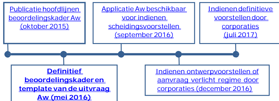
Figuur 1 Tijdschema

De tijdsplanning om te komen tot de definitieve beoordeling van de scheidingsvoorstellen door de Aw is weergegeven in onderstaand schema.