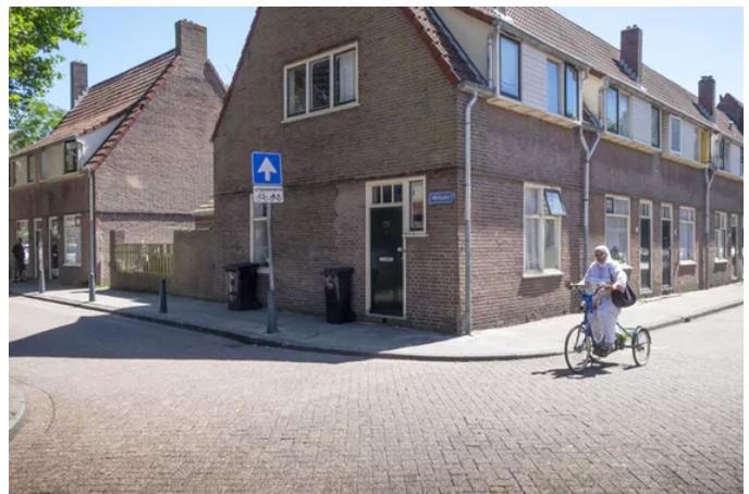
Corporatiewoningen in tuindorp Vreewijk in Rotterdam-Zuid.

In maart dit jaar startte de evaluatie van de Woningwet 2015, onder toezicht van een klankbordgroep waarin alle betrokken instanties zijn vertegenwoordigd. Durven de onderzoekers, net als wij, te concluderen dat een fundamentele koerswijziging wenselijk is in het toezicht op woningcorporaties? Laat dit artikel voor hen een prikkel zijn.